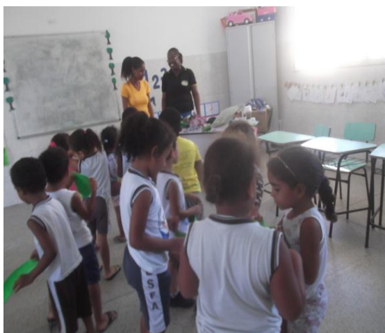
13. CANTANDO A MUSICA “FUI AO MERCADO”

Nesse sentido, “A música desempenha em destaque, contribuindo para o desenvolvimento do aluno no que diz respeito à linguagem oral, O ritmo, a entonação e a musicalidade das palavras funcionam como reais possibilidades de despertar a criança para a comunicação, proporcionando-lhe sorrisos e gargalhadas, além de garantir o contato com a oralidade de uma forma lúdica e descontraída” (KAUFMAN 1995).