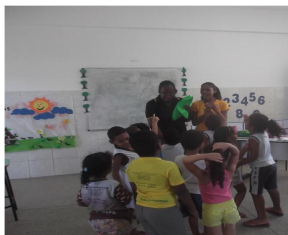
14. CANTANDO A MUSICA “FORMIGUINHA”