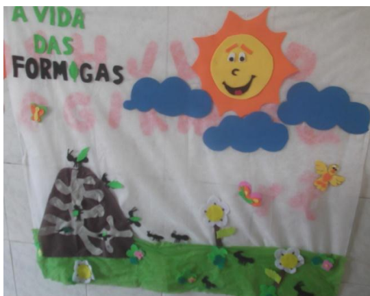
7.ROTINA DAS FORMIGAS

Em seguida as crianças foram conduzidas até um painel que ilustrava um formigueiro (figura 7 e 8), para que dessa forma as mesmas pudessem relacionar o que viram, criando novos questionamentos a respeito do trabalho que as formigas realizam em grupo, o painel ilustrou muito bem a rotina das formigas, possibilitando dessa forma na descrição feita por elas a partir do que observavam. “A descrição de algo pela criança requer-lhe coordenar as próprias impressões e processos mentais. Implica processo gestual ou identificação do objeto consigo mesmo, estabilizando por sua vez, as tarefas de definir e de explicar.” (OLIVEIRA 2007, p.153).